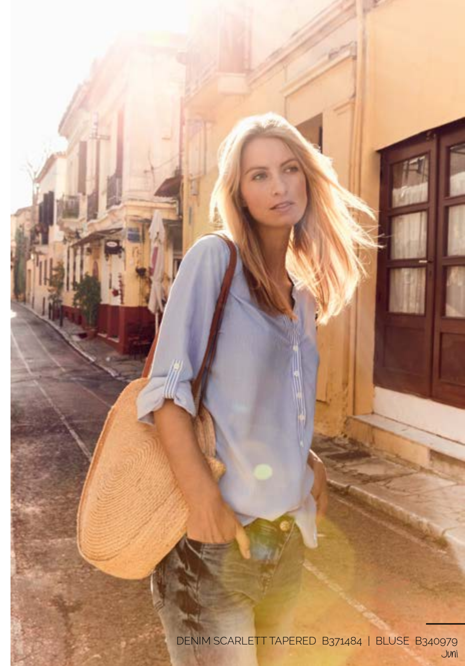
DENIM SCARLETT TAPERED B371484 | BLUSE B340979 JUNI

Steigen die Temperaturen, werden die Styles kürzer. Da trifft es sich wunderbar, dass in diesem Sommer lässige Shorts, Capris und Röcke im Trend