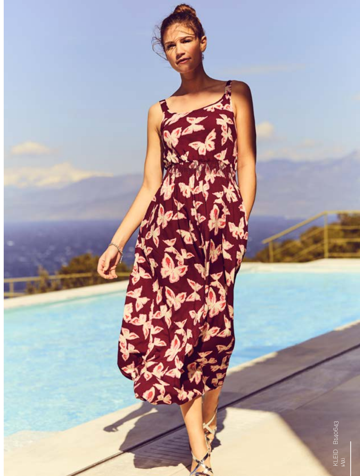
KLEID B140643 VW

Prints: dunkle Hintergründe bringen etwas Exotik zu Dir und die schönsten Farben der Saison zum Leuchten, zum Beispiel Powder Blue, Ginger-Mint oder Soft Blossom.